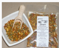
Biryani Gewürzmischung ohne Glutamat / 50 g 1.30EUR